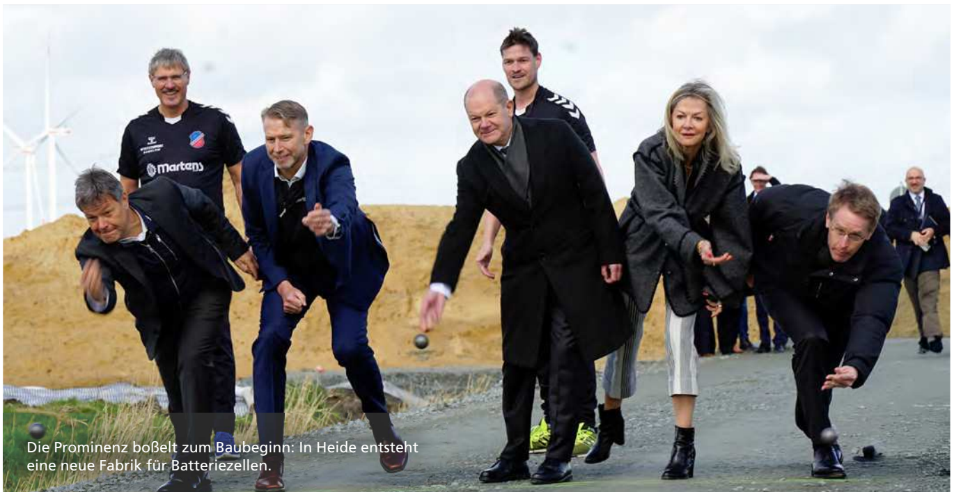
Die Prominenz boßelt zum Baubeginn: In Heide entsteht eine neue Fabrik für Batteriezellen.